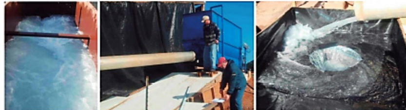
Vista interior de la agitadora de Tolva

Pruebas de eficiencia de filtración, TSS y TPH realizadas en gran escala, condiciones reales en un laboratorio acreditado de pruebas de control de erosión. (Ver los informes completos de pruebas en www.inletfilters.com ).