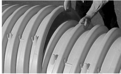
Figura 1. Empalme entre cámaras

Las tapas tienen un sentido de unión, que se indica con flechas y leyendas que están grabadas en el lomo superior de la cámara. El valle de la corrugación inmediato a un lado de la corrugación de unión inferior está marcado con: “Overlap Here – Lower Joint” (Empalmar Aquí – Junta Inferior). El valle de la corrugación inmediata a un lado de la corrugación de unión superior está marcado “Build This Direction – Upper Joint” (Ensamble en esta dirección – Junta Superior).