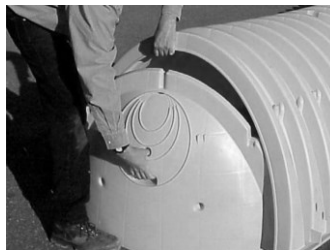
Figura 2. Colocación de las tapas

Se deben colocar tapas en el extremo inicial y final de las hileras formadas por las cámaras, para evitar la migración del material de relleno al interior de las cámaras. Las tapas están diseñadas para empalmarse manualmente, sin la ayuda de equipo o maquinaria y deberán de colocarse dentro de las corrugaciones de unión de las cámaras, de acuerdo con la siguiente Figura 2.